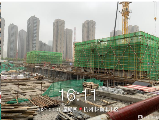
2、项目地块 2#、3#楼施工至二层