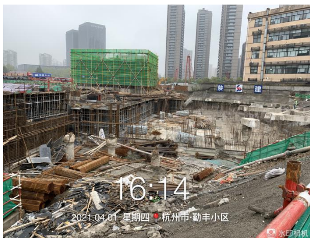
1、项目地块 1#楼施工至脚撑破桩