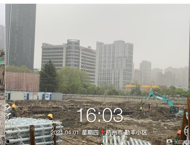
6、项目地块 9#、10#楼施工至首道支撑梁