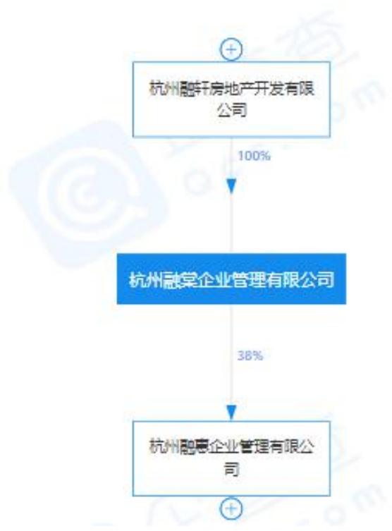
图 1 杭州融棠企业管理有限公司股权穿透图

(2) 2020 年 6 月 23 日杭州市土地交易中心公示杭政储出【2020】41 号地块