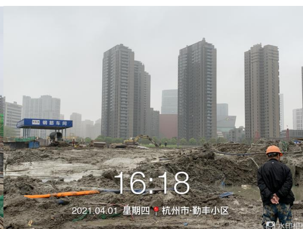
4、项目地块 6#、8#楼施工至土方开挖