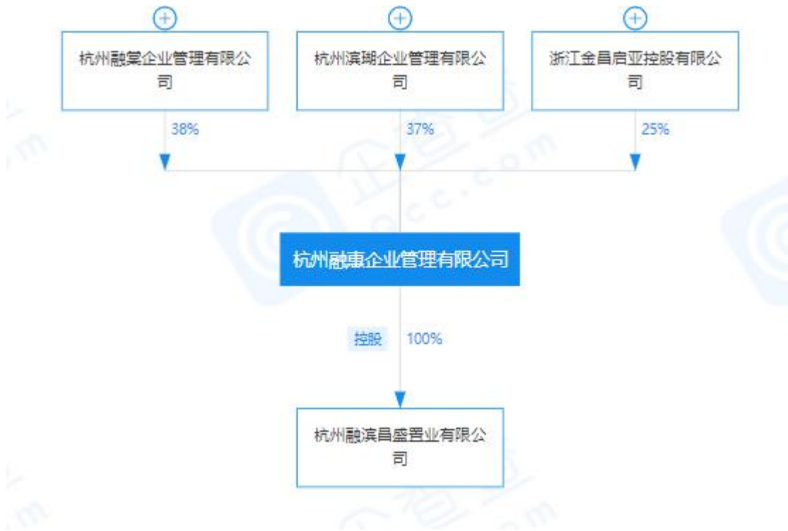
图 2 项目公司股权穿透图

2、合资公司以总价 299,550 万元竞得庆隆小河单元 GS0304-R21/B1/B2-01 地块，起拍价为 235,550 万元；楼面地价 24,774 元/m 2 ，并于 2020 年 9 月 30 日取得不动产权证书。项目四至：东北侧为莫干山路，西北侧为登云路，东南侧为正德里街，西南侧为李家桥工业园区。总面积为 48365 m 2 ，用途为住宅、商业商务用地。容积率为 \leq 2.5 ，绿地率 \geq 35\% 。