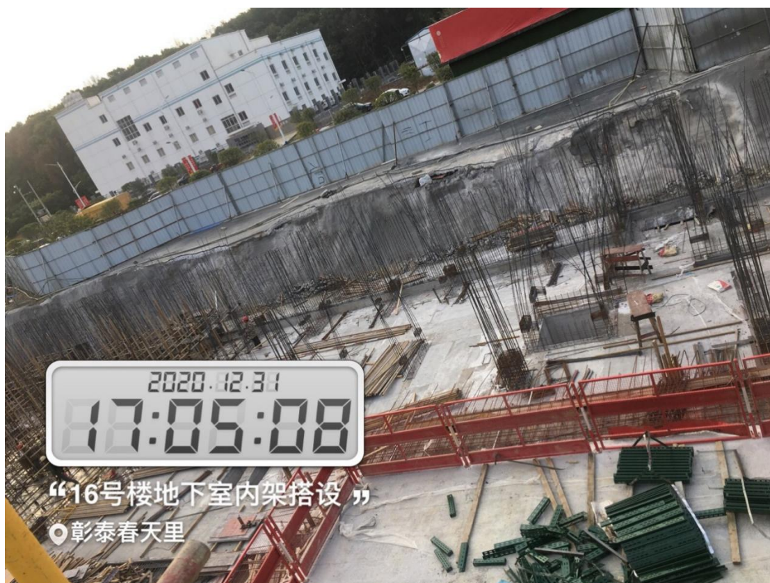
16#楼地下室底板浇筑完成