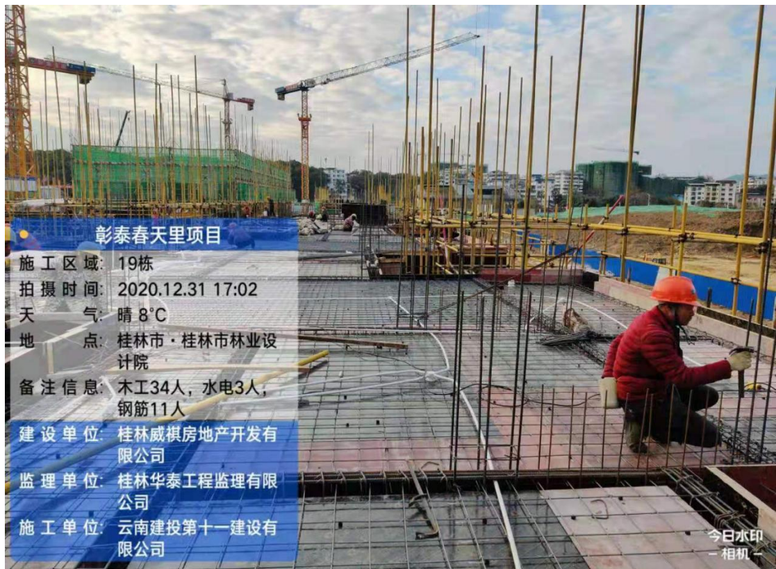
19#楼二层梁板钢筋绑扎约 70%