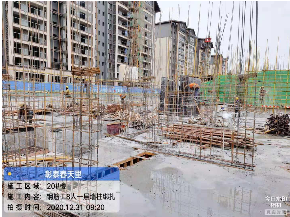
20#楼一层墙柱钢筋绑扎约 30%