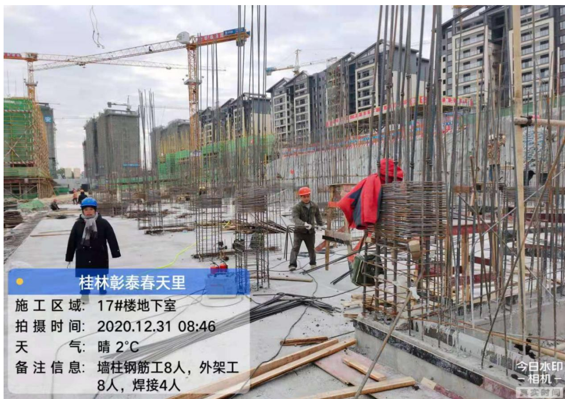
17#楼地下室墙柱钢筋绑扎 40%