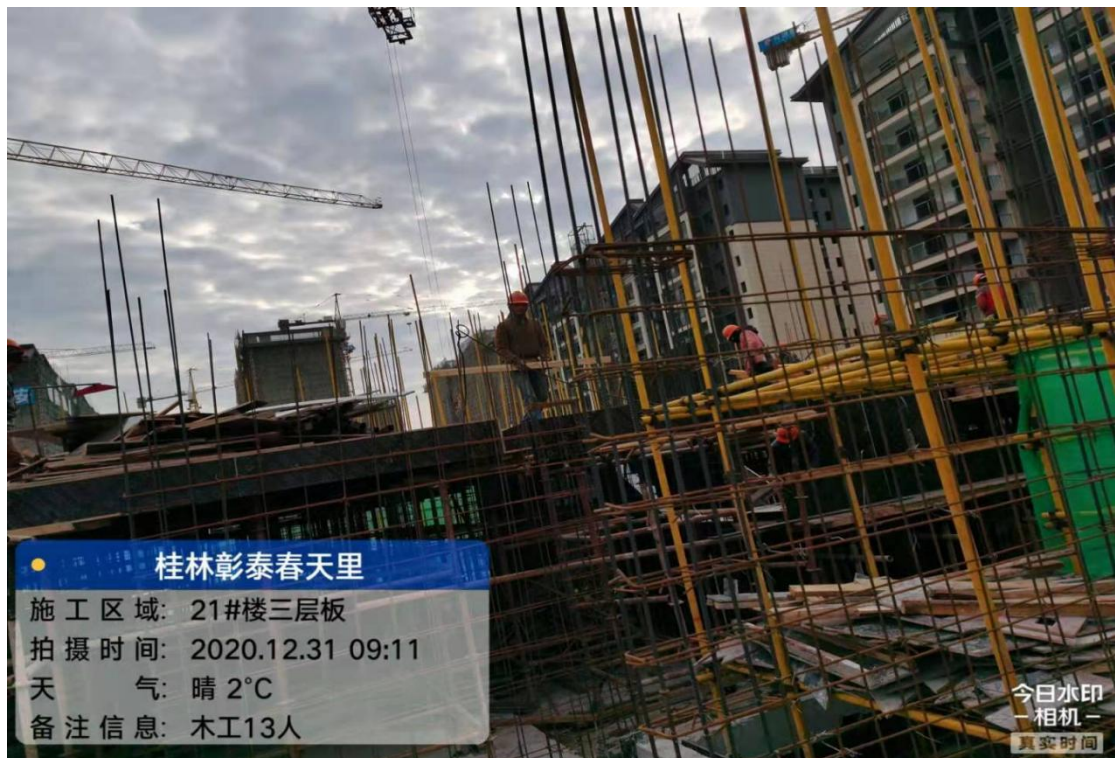
21#楼三层梁板模板安装完成 30%