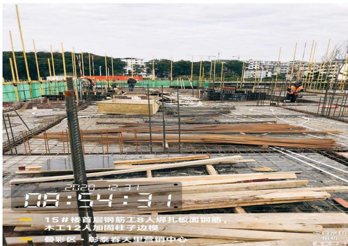
15#楼一层梁板钢筋绑扎完成 80%