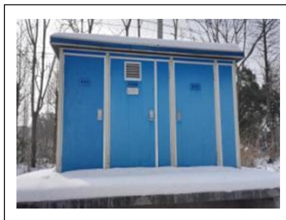
6、B 地块内新安装的箱式变压器