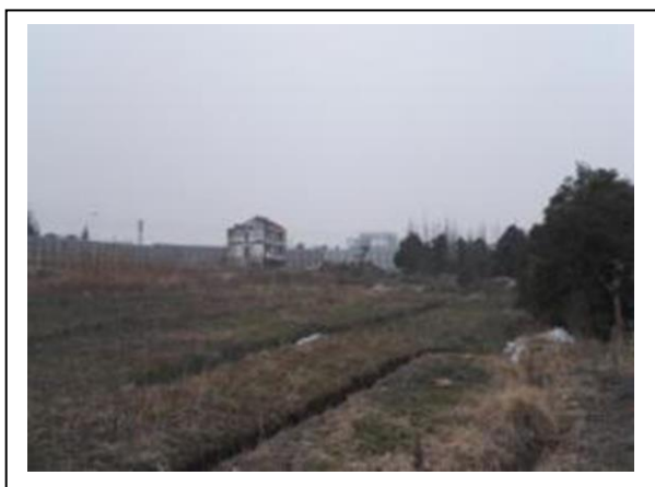
11、A 地块内农作物及未拆迁房屋