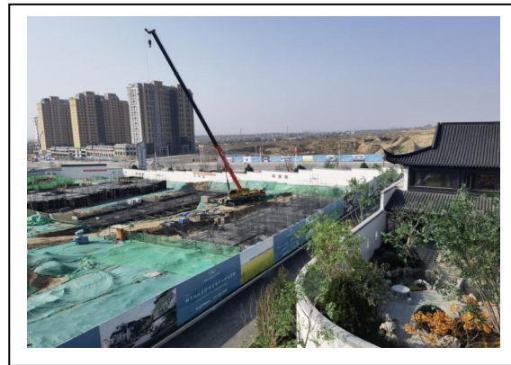
4.A-3 地块样板区（生活服务中心）照片