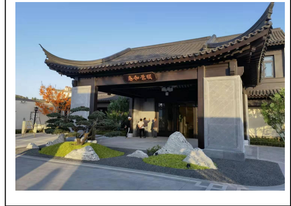
2.A-3 地块样板区（叠拼）照片