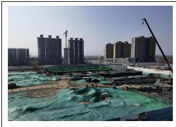
3.A-3 地块样板区（生活服务中心）照片