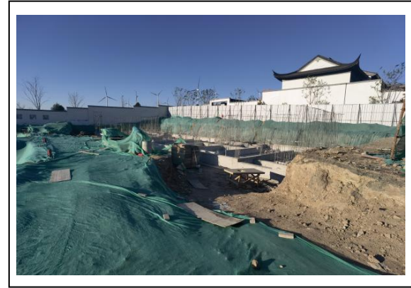
6.1-7#、1-8#楼基础筏板浇筑完成