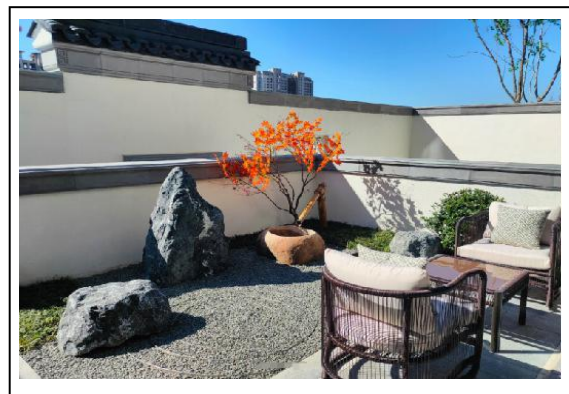
2.A-3 地块样板区(叠拼)照片