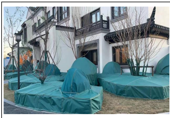
1.A-3 地块样板区(叠拼)照片