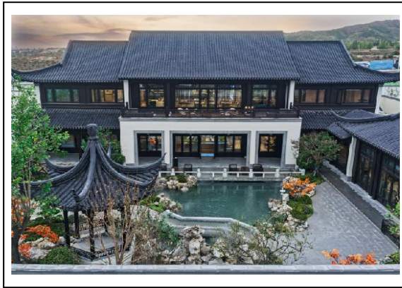
3.A-3 地块样板区（生活服务中心）照片