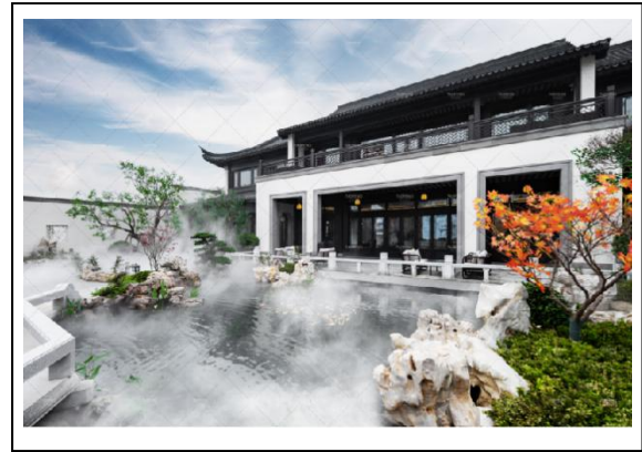
4.A-3 地块样板区（生活服务中心）照片