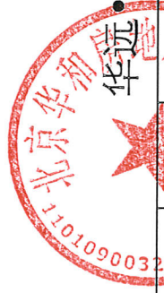
华远·好天地项目租赁情况表