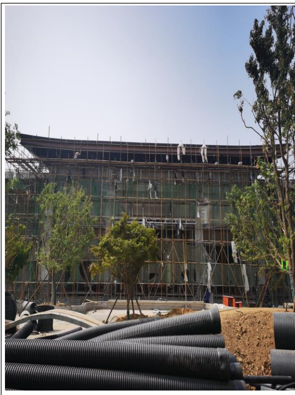
2、项目 3 号地围挡内售楼处施工现场