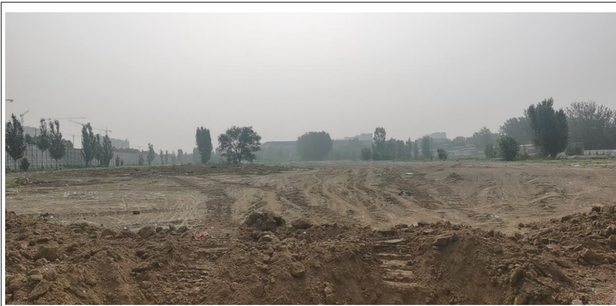
1、项目 1、2 号地围挡内现场 （因防止倒垃圾围挡封闭，缝隙照）