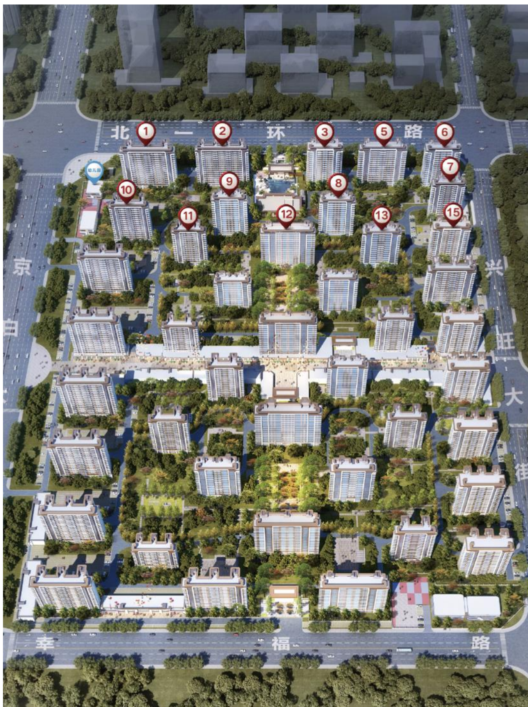
白沟新城许庄 341 亩建设工程计划项目沙盘模型图

保定白沟新城恒郡市场服务有限公司名下持有《国有土地使用证》【保白国用（2014）第 000365 号、第 000366 号、第 000362 号】（分别对应 1#、2#、3#地块），后 2016 年公司准备开发建设“白沟箱包产业配套服务中心”项目，并于 2016 年 9 月 6 日办理了《建设用地规划许可证》【地字第（2016）004 号】。后受 2017 年雄安新区成立影响，原设计理念、设计方案明显无法匹配新区建设要求，致使项目至今尚未开工建设。