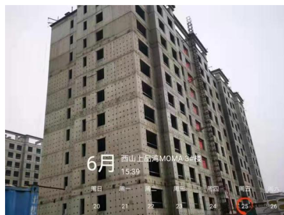
4、西山上品湾 MOMA 项目 3 号楼现场