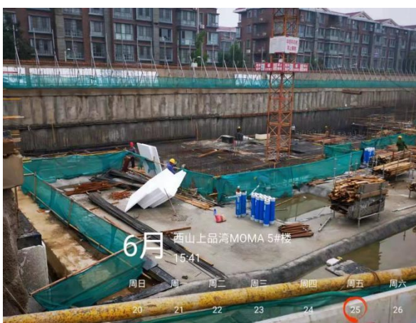
5、西山上品湾 MOMA 项目 5 号楼工地现场