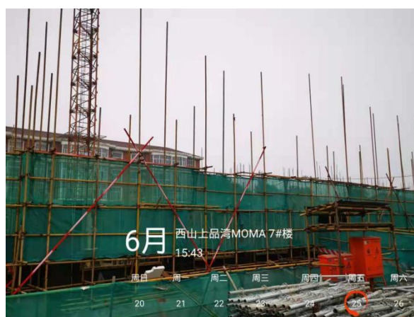
6、西山上品湾 MOMA 项目 7 号楼现场