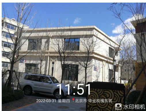
3、标的项目 3# 配套楼