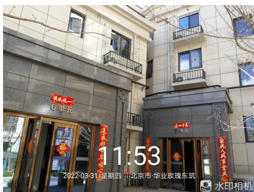
5、标的项目 1#楼 5、6 单元