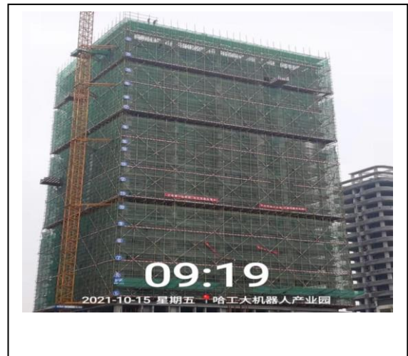
9、商业四期 8 座照片