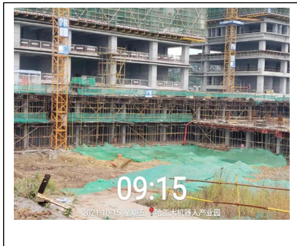
14、商业四期 18 座照片