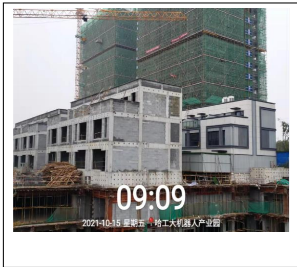
12、商业四期 6/7/9/10 座照片