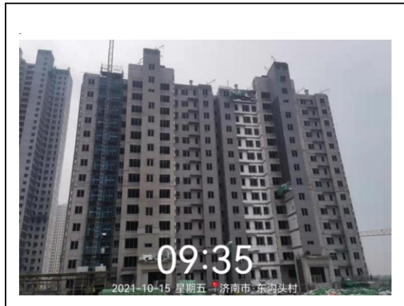
4、玖悦府一期 8#楼照片