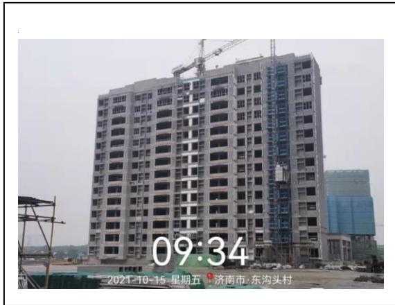
2、玖悦府一期 7#楼现场照片