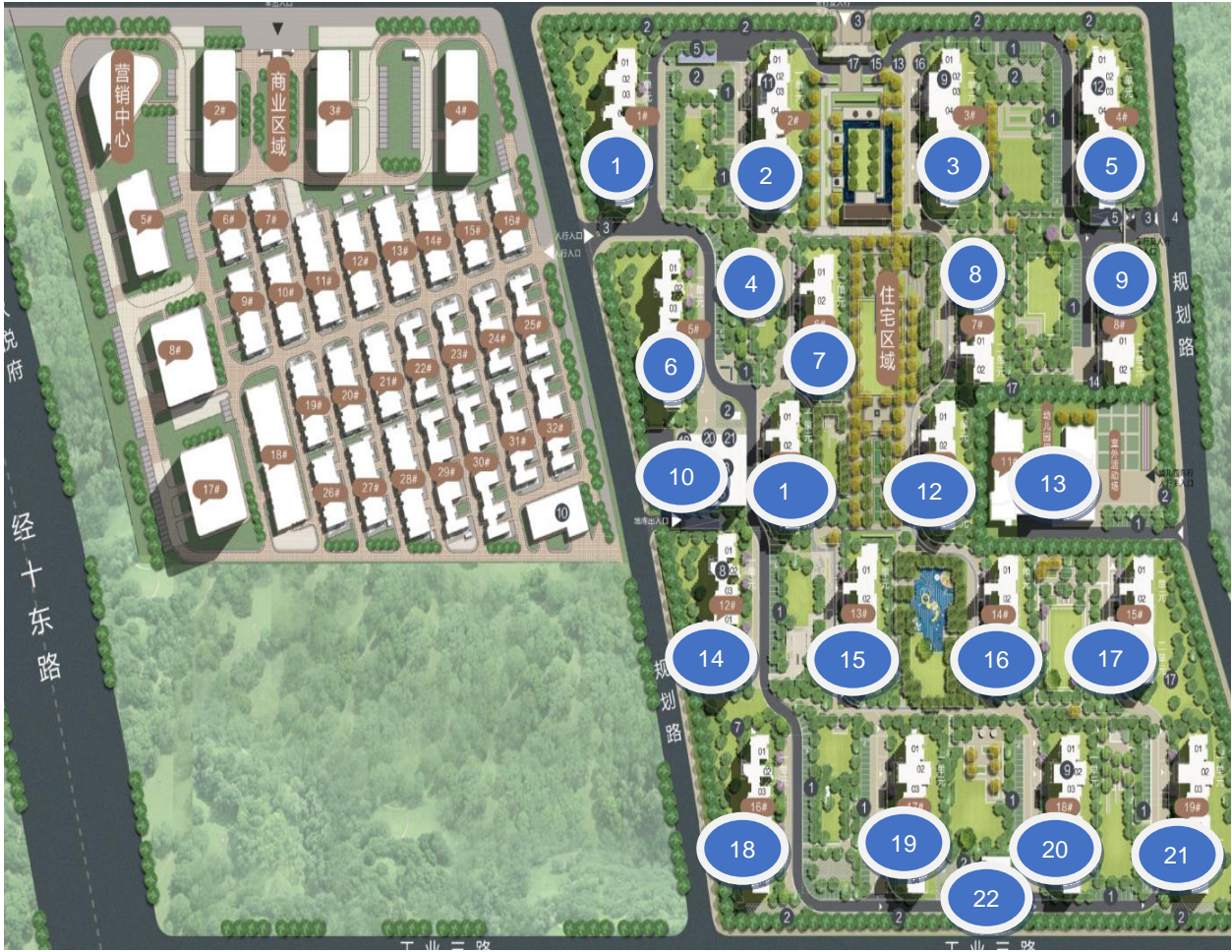
附件四 标的项目平面图