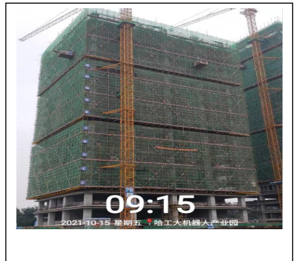
13、商业四期 17 座照片