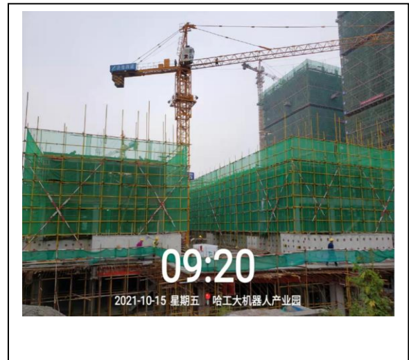
11、商业四期 11/12 座（3F）照片