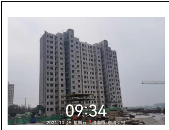
3、玖悦府一期 9#楼照片