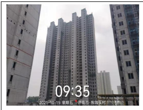
5、玖悦府一期 5#楼照片