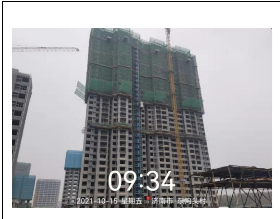
1、玖悦府一期 2#楼现场照片