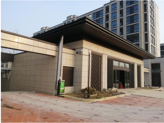
7、二三地下室出入口