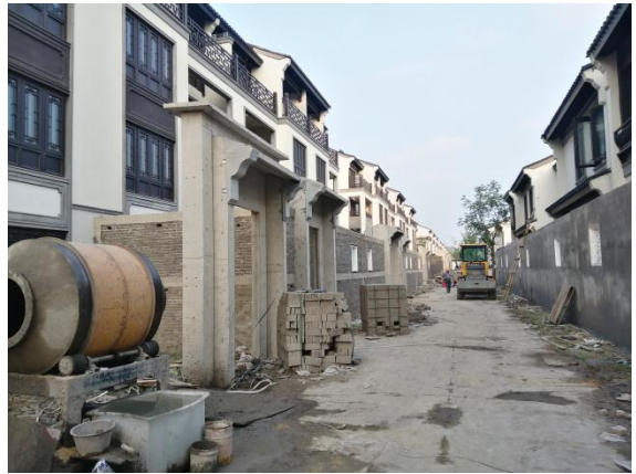
10、低密区围墙砌筑、抹灰