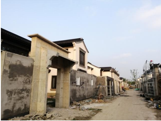
1、品质提升门头浇筑