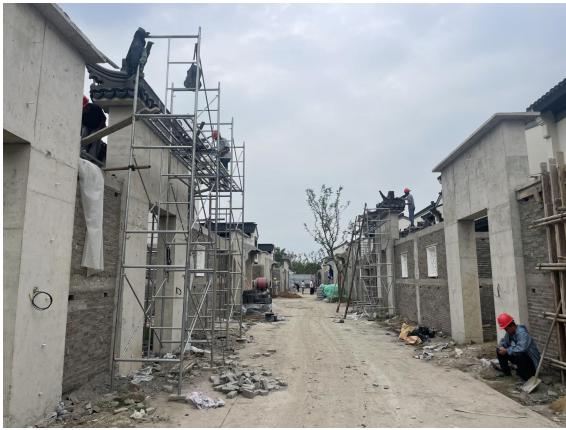
3、门头垛头安装、瓦作施工