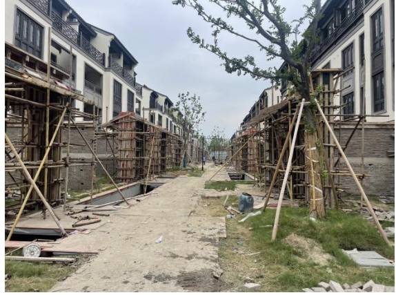
2、品质提升门头支模