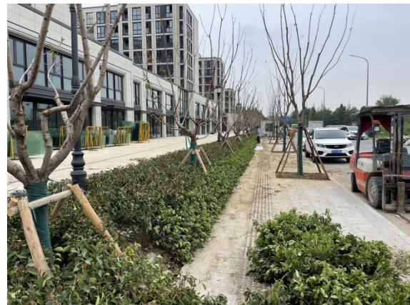
6、地块西侧道路绿植现状