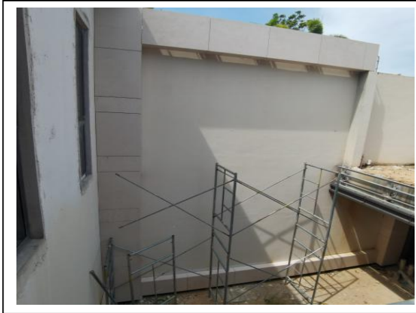
7、三期地下室石材装修