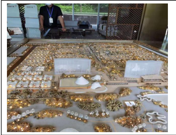
1、海棠华著项目沙盘