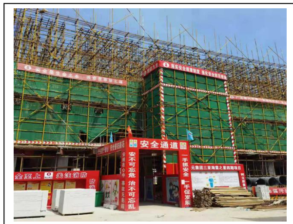
16、四期酒店式公寓二层施工现场