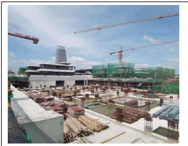
13、四期 E 栋（3#、4#）别墅封顶