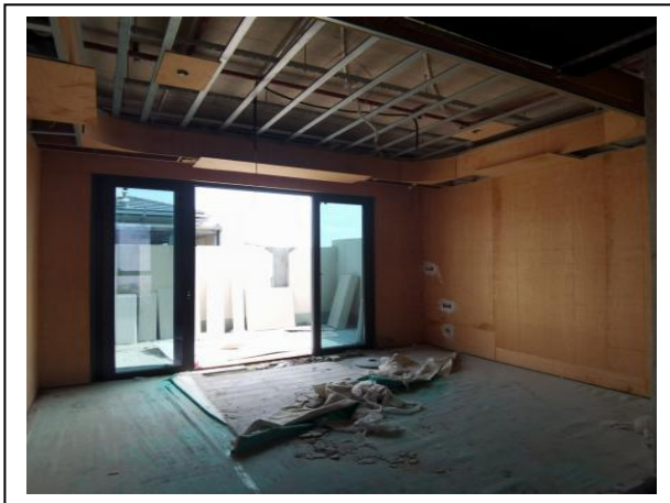
5、三期室内刮腻子挡板安装