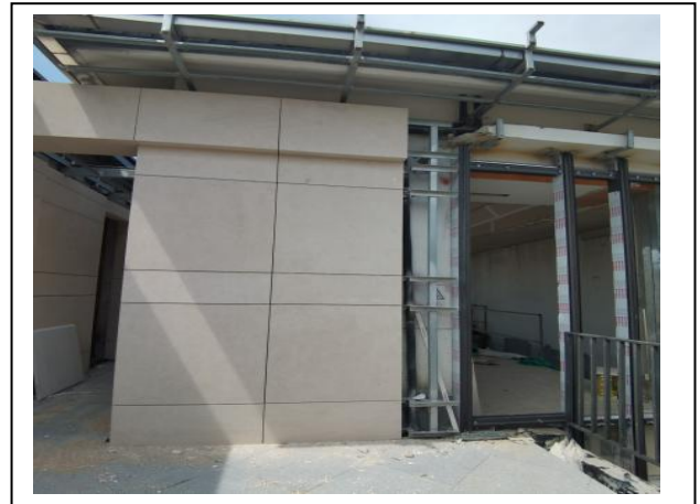
4、三期外墙石材安装