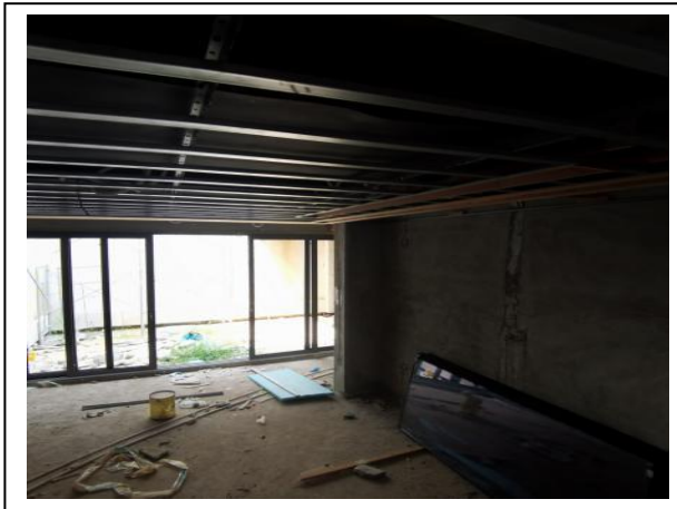
3、三期地下室内装修