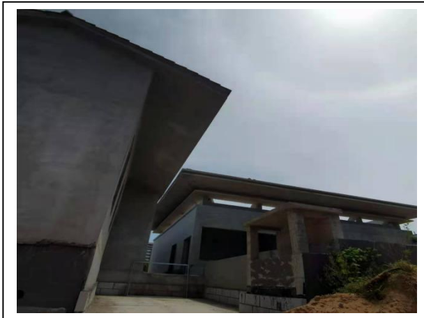
9、三期文化荟外墙抹灰