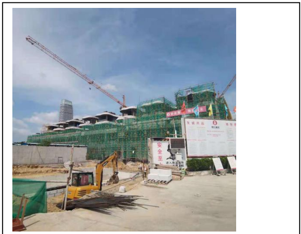
11、四期 F 栋别墅封顶完成