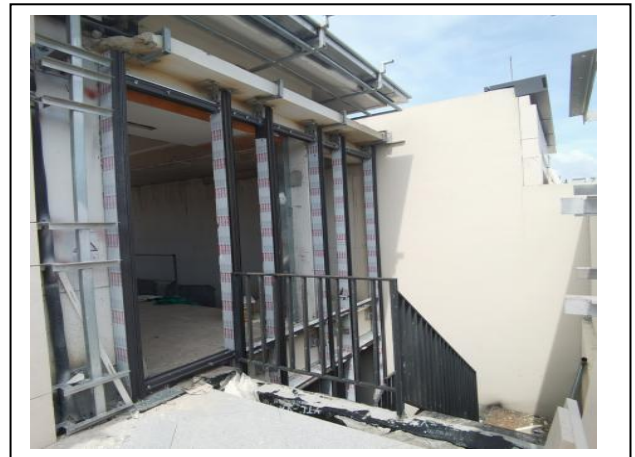
6、三期室内玻璃门窗安装