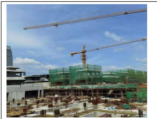
15、四期 D 栋（1#—11#）别墅封顶