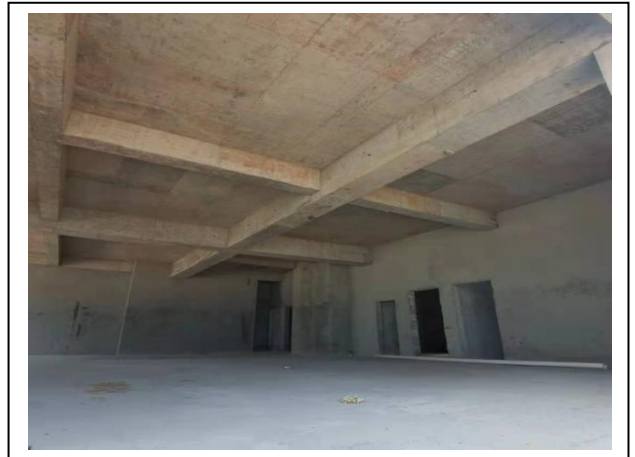
10、三期文化荟内墙抹灰