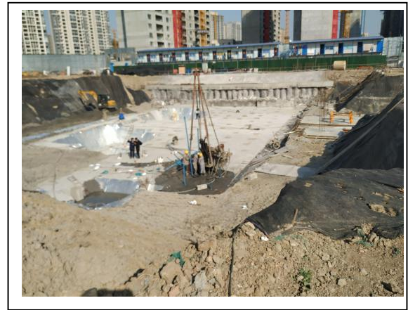
4、7 号楼现场施工现场