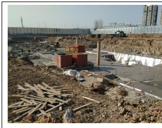
5、9 号楼现场施工现场