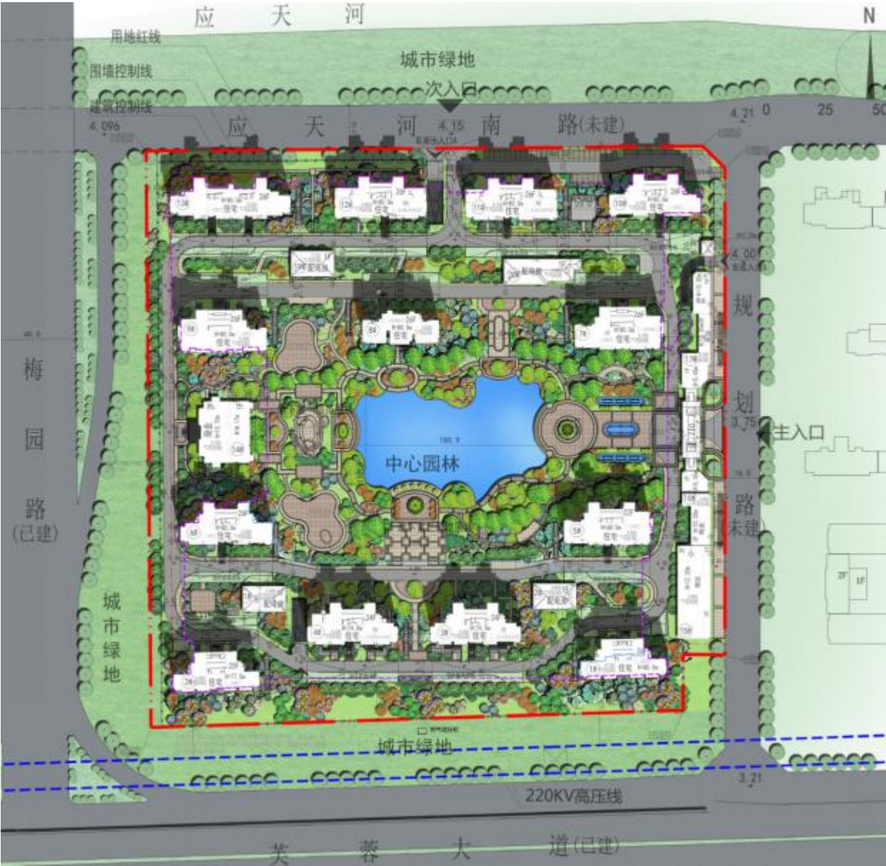
附件四 项目平面图