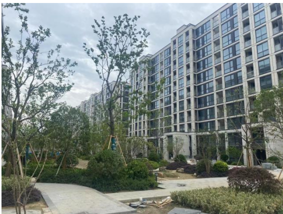
3、二三期部分景观现状