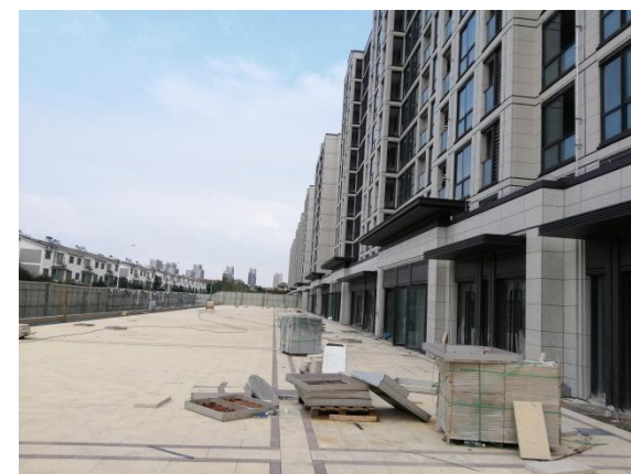
10、二三期室北侧道路现状