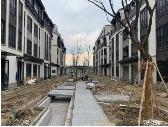
5、二三期叠墅区巷道水景现状