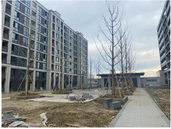
6、二三期西入口处景观现状