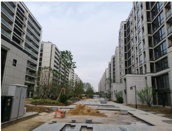
9、二三期小高层区域室外现状