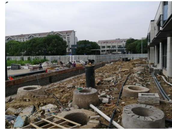
8、二三期西北侧室外现状