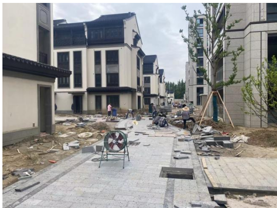
4、二三期巷道石材铺设