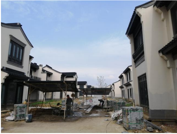
7、二三期合院区巷道石材铺设