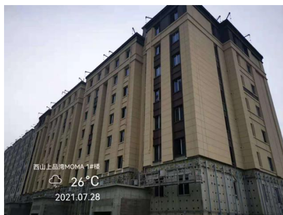
4、西山上品湾 MOMA 项目 1 号楼现场