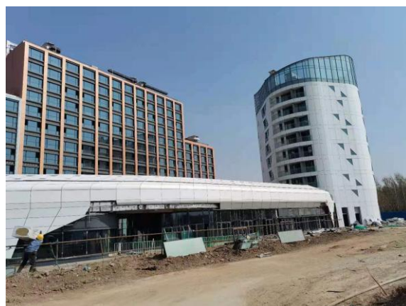
2、时光里项目 9#工地现场