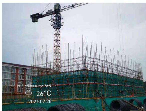
6、西山上品湾 MOMA 项目 7 号楼现场