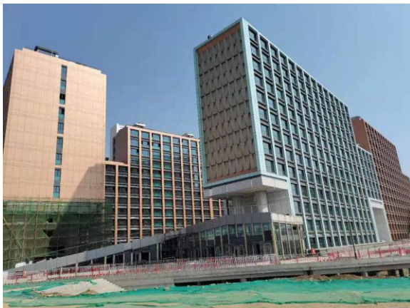
1、时光里项目 1#、2#工地现场