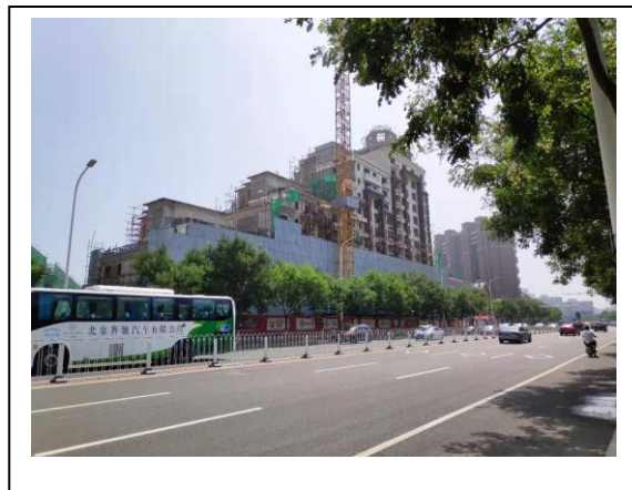
2、标的项目 1 号楼西北侧