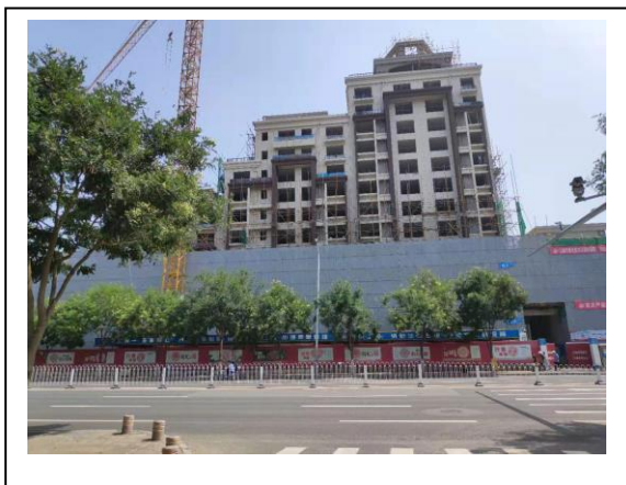
1、标的项目 1 号楼西侧已拆除部分围挡