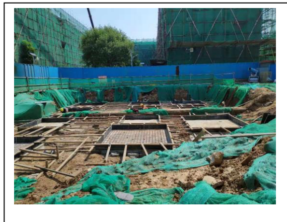
4、标的项目 3 号配套楼施工现场