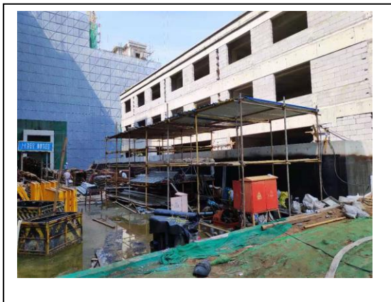
3、标的项目 2 号配套楼