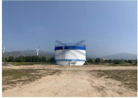
6. 农庄、宠萌乐园内旧水塔改造完成