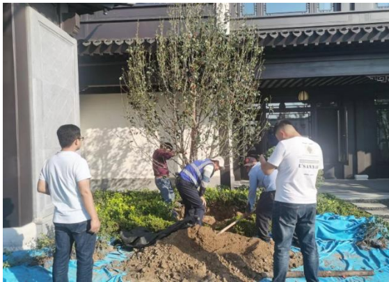
7. 示范区院内更换移植海棠树完成