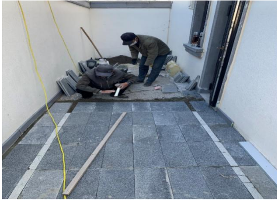
5. 示范区样板间一楼西侧小院铺装面修复完成