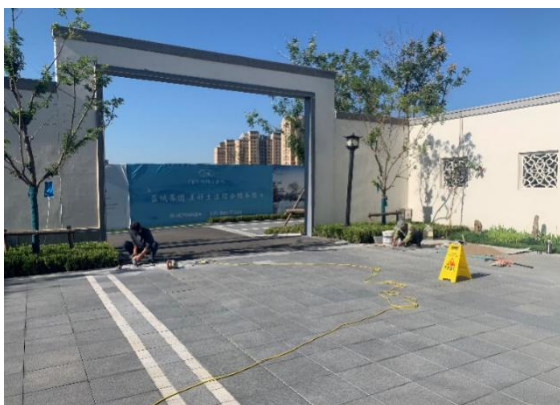
3.示范区庭院内铺砖面修复完成