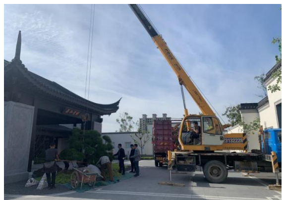
4.示范区售楼处落客门厅迎客松更换完成