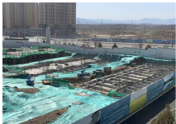
2.大区1-7#、1-8#楼基础筏板浇筑完成