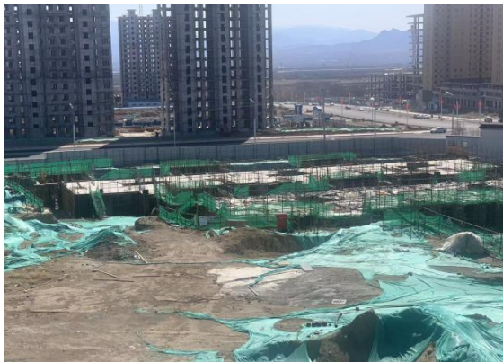
1.大区1-2#、1-3#地下室顶板浇筑完成