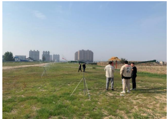
8. 农庄、宠萌乐园日常检查工作完成