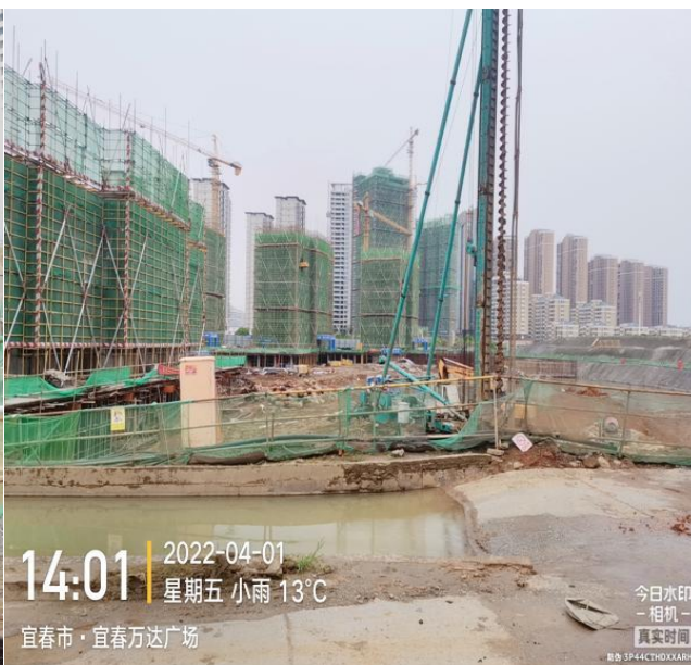
4#、11#未开工，其它楼栋（除 1 栋）处于地下室施工阶段