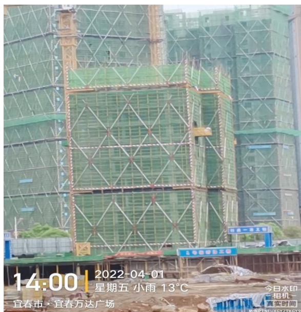
5#主体施工至十一层