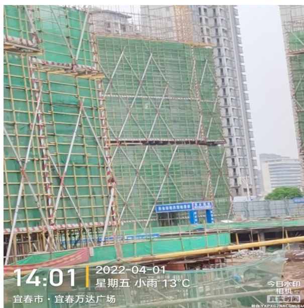
2#主体施工至十一层