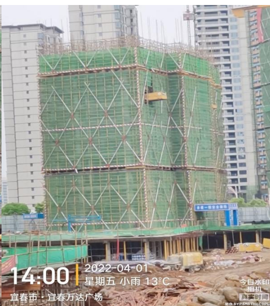
3#主体施工至十一层