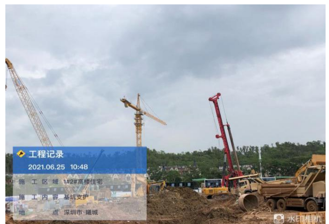
1#2#基坑支护，土石方阶段