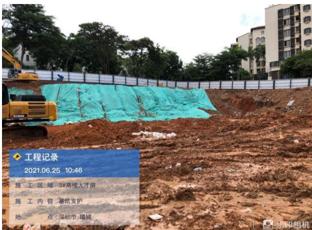
3#基坑支护，土石方阶段