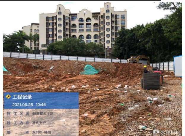
4#基坑支护，土石方阶段