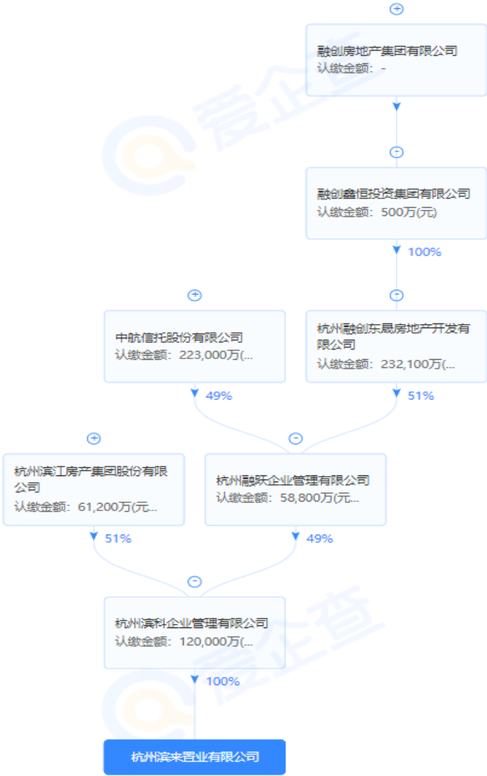
项目公司股权穿透图

2. 杭州望江未来社区项目位于浙江省杭州市上城区，项目四至：东至规划凯旋路、规划莫邪塘路，南至规划绿化、规划始版桥路，西至规划始版桥路直街，北至规划绿化、规划凯旋路。占地面积为 43,652 m 2 ，总建筑面积 292,291 m 2 ，地上计容建筑面积 212871 m 2 。用途为住宅兼商业服务业设施用地、商业商务用地。SC0402-R21/B-05 地块是住宅与商业服务业用房，商住比例为 4:6，容积率为 \leq 4.5 ，建筑密度 \leq 40\% ，绿地率 \geq 30\% ，建筑限高 95 米；SC0402-B1/B2-11 地块是商业商务用房，容积率为 \leq 5.5 ，建筑密度 \leq 50\% ，绿地率 \geq 25\% ，建筑限高 100 米。