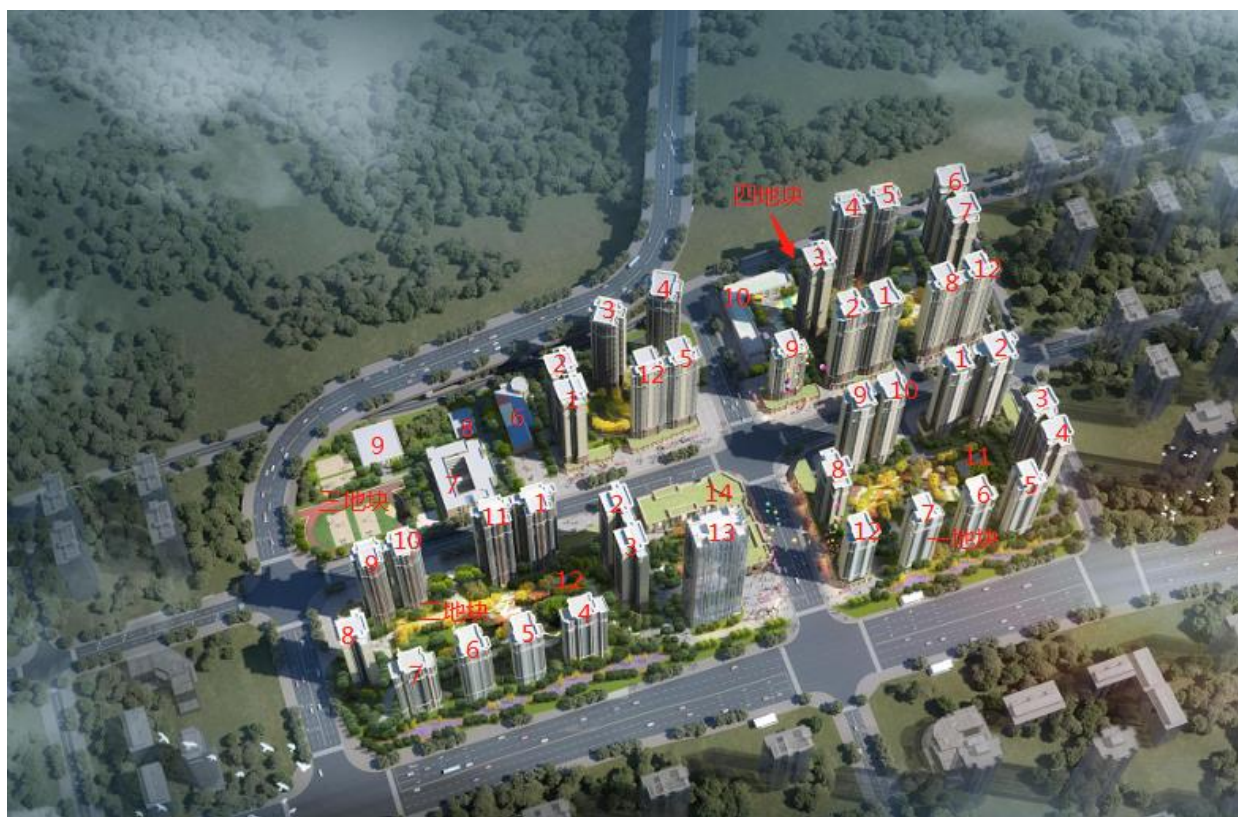
附件三 项目平面图