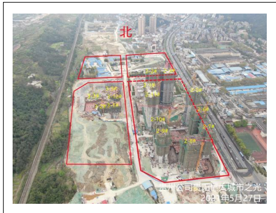
1.城市之光项目 8 月 073 地块航拍