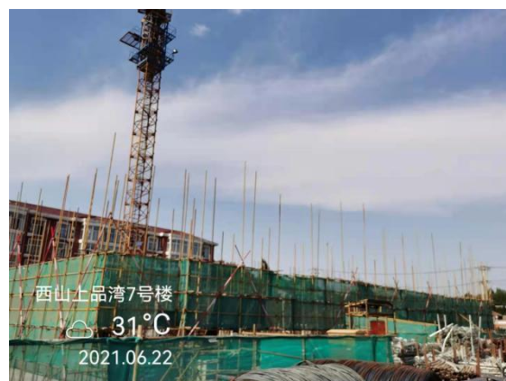
4、西山上品湾 MOMA 项目 7 号楼现场