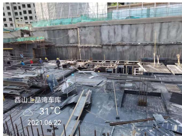
6、西山上品湾 MOMA 项目车库工地现场