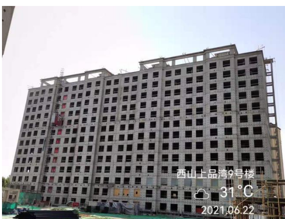
5、西山上品湾 MOMA 项目 9 号楼工地现场