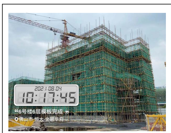
6#楼 6 层模板完成