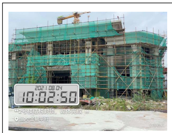
2#楼结构封顶、砌体完成