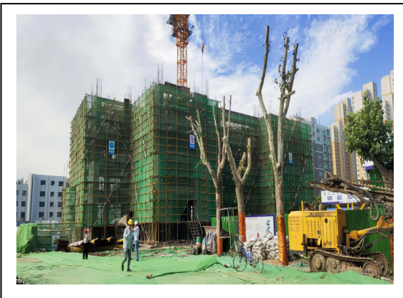
8#楼三层顶板混凝土浇筑完成