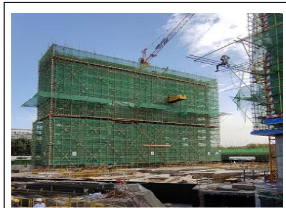
2#楼十二层梁顶板模板安装完成 50%