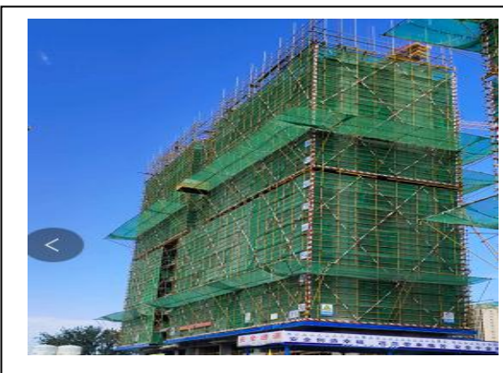
3#楼十四层梁顶板钢筋绑扎完成