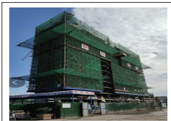
1#楼十三层梁顶板模板安装完成 55%