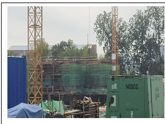
5#楼二层顶板模板完成 80%，内模架加固；