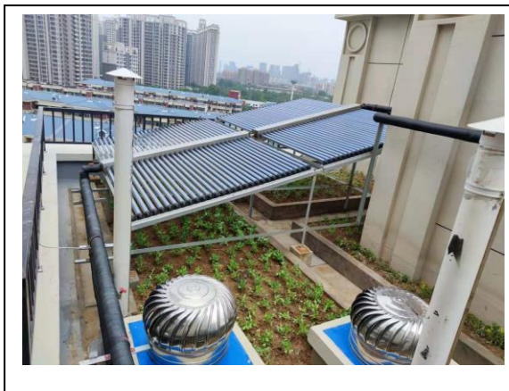
3、标的项目 1#楼顶太阳能板及楼顶绿植