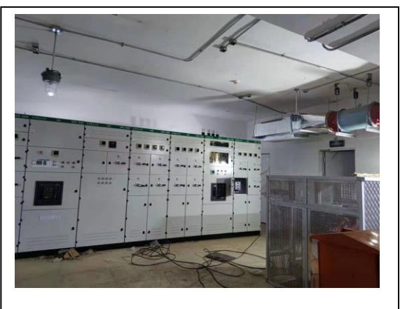
5、标的项目地下车库配电室