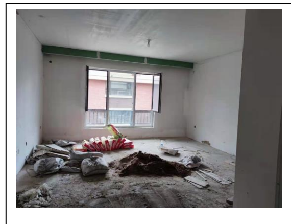
4、标的项目 1#楼住宅精装修施工