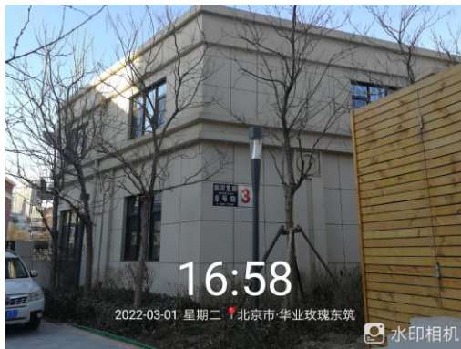
3、标的项目 3# 配套楼