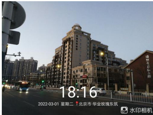
1、标的项目 1# 楼