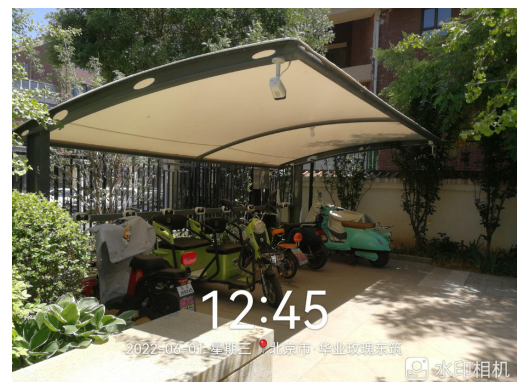
6、小区电动单车充电棚