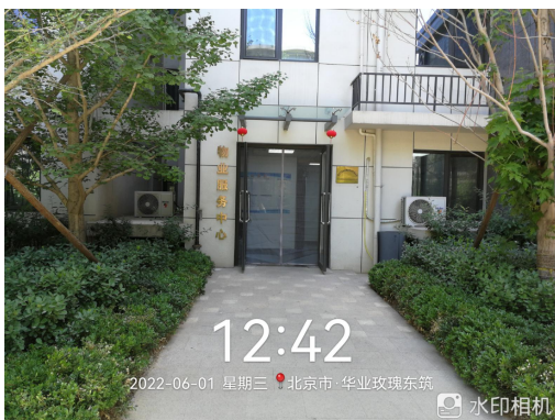
5、小区物业服务中心