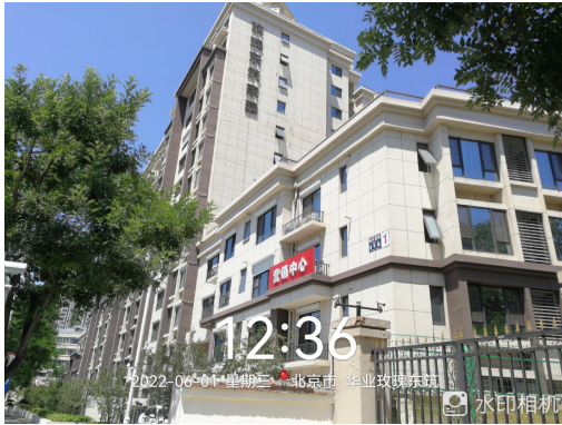
1、标的项目 1# 楼