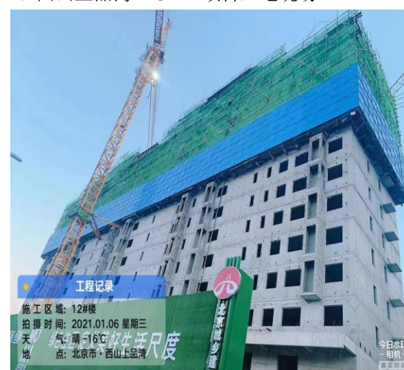
6、西山上品湾 MOMA 项目工地现场