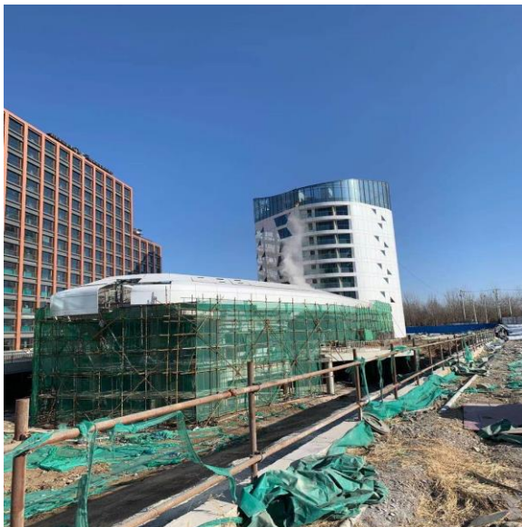
3、时光里项目工地现场