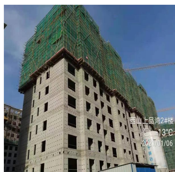
4、西山上品湾 MOMA 项目工地现场