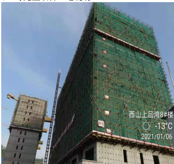
5、西山上品湾 MOMA 项目工地现场