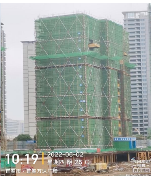
3#楼十六层梁板浇筑完毕