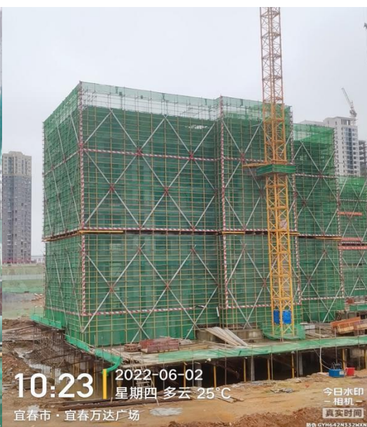
9#楼八层梁板内架搭设