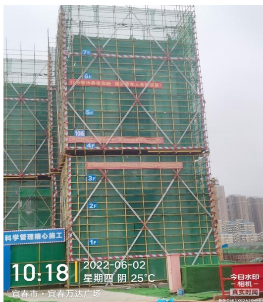
10#楼七层梁板内架搭设