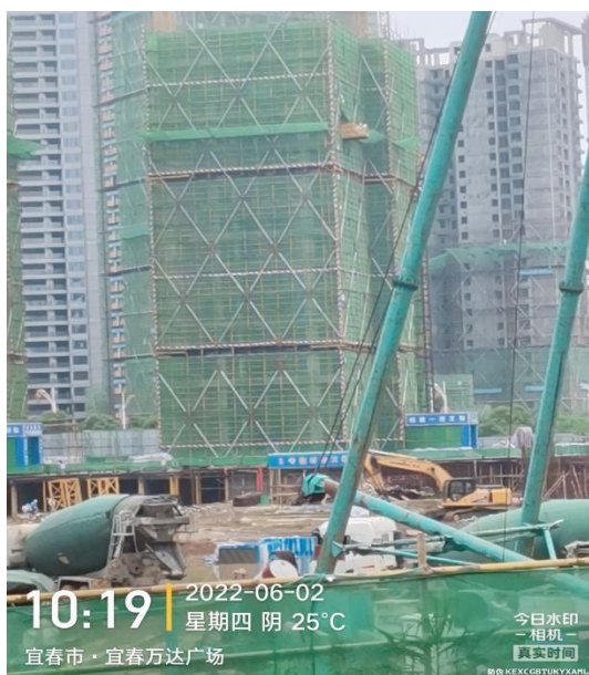
5#楼十五层梁板钢筋绑扎