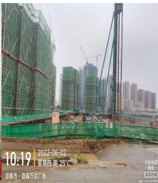
其它楼栋（除 1 栋外）处于地下室施工或楼底板完成阶段