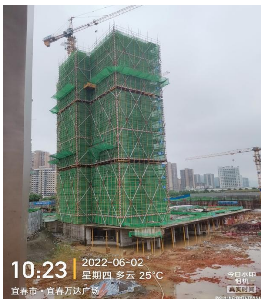
2#楼十六层梁板钢筋绑扎